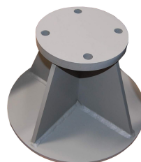
ASB – R avec PKL 200