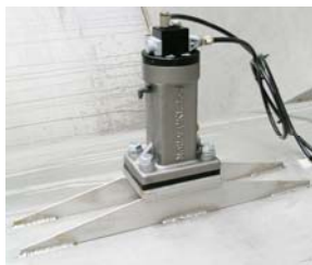
ASB – G 150 S avec PKL 150

De par la méthode de construction particulière des consoles de montage à souder, la frappe d'impulsion du PKL se répand de façon régulière sur la paroi du réservoir afin de décoller le matériel adhérent tout en ménageant les soudures.